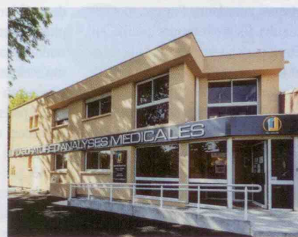
Laboratoire BIO-SANTIS, à Montfavet (84).

⇒ Les difficultés sont considérables et multiples. Le temps est un facteur essentiel. Il n'est pas raisonnable, selon moi, d'envisager accréditer un laboratoire à 100 % en moins de 10 ans. Par ailleurs, travailler en « mode accrédité » est coûteux, très exigeant. Il y a un monde entre un laboratoire travaillant sous la norme et un laboratoire non accrédité. Je ne pense pas que les gros laboratoires soient globalement avantagés, au contraire. Les meilleurs laboratoires sont souvent monosite. Un